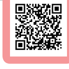
捐款陪伴 屏東家暴目睹兒