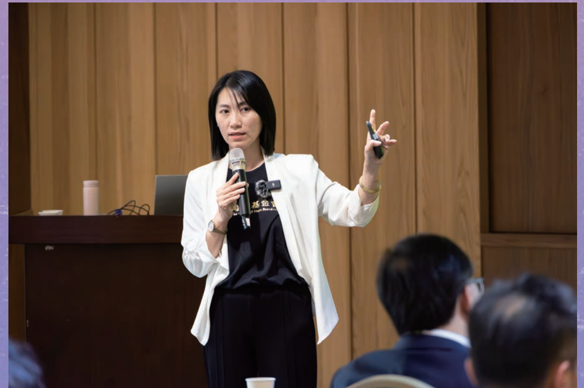
勵馨 113 年職場性騷擾防治講座諮詢接洽超過 100 通，企業職場性騷擾專講 94 場，需求較 112 年提升 3 倍。

勵馨 113 年職場性騷擾防治講座諮詢接洽超過 100 通，企業職場性騷擾專講 94 場，需求較 112 年提升 3 倍。這也顯示在《性工法》新法上路後，多數企業開始重視職場性騷問題，但實際要如何操作仍是滿頭問號。