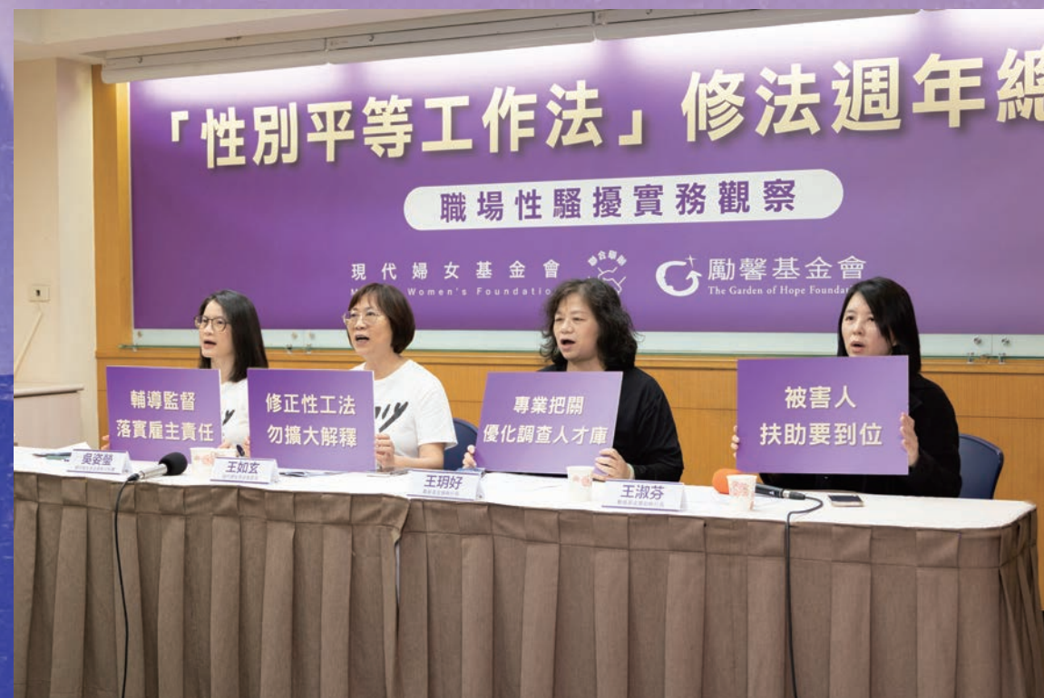
今年 3 月，勵馨基金會與現代婦女基金會共同舉辦「性別平等工作法」修法週年總體檢記者會，呼籲勞動部就被害人扶助資源到位、啟動雇主輔導、監督機制，以及相關法規的修正與整合進行改善。

「我需要法律諮詢或心理諮商等資源，但不知如何申請，各縣市資訊模糊，規則不一，甚至連專責單位也說不清。」