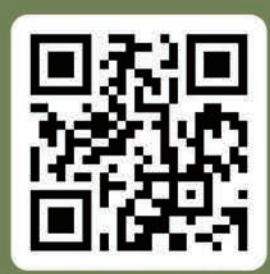
捐款支持 陪伴孩子長大